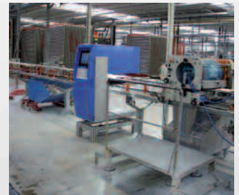
CeraScreener® Anlage mit Ausschleusung

Ein kompaktes und mobiles Inspektionssystem zur Siebdrucküberwachung in der Glasierlinie. Die Druckbilder unterschiedlicher Motive werden kontinuierlich überwacht, fehlerhaft bedruckte Fliesen vor dem Brand aussortiert; bei Serienfehlern wird ein Alarm ausgelöst.